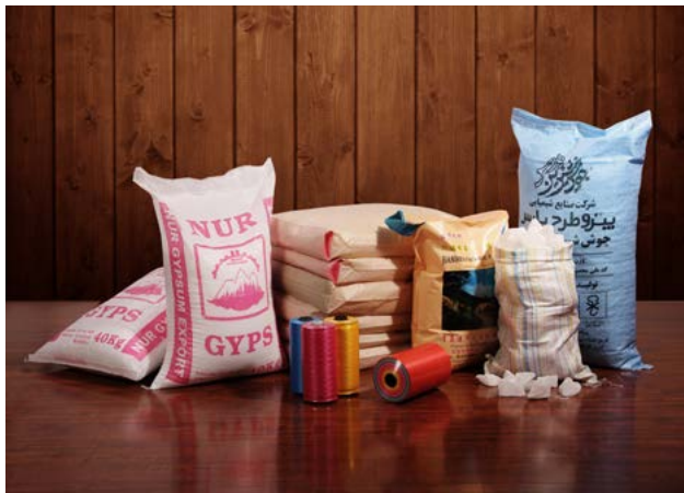
کیسه‌های مخصوص مصالح ساختمانی و معدنی

در تولید کیسه‌های سیمان، گچ، پودر سنگ و از این نوع که به لحاظ بسته‌بندی نیاز به استحکام و انعطاف مناسب دارند، توجه به مؤلفه‌های کیفی نخ‌های تشکیل‌دهنده تاروپود این نوع کیسه‌ها از نظر کنترل آزمایشگاهی امری ضروری است.