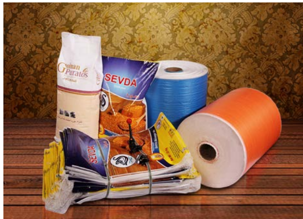
خدمات تکمیلی: چاپ، لمینیشن کوئینگ و کامپوزیت

در تولید کیسه‌های سیمان، گچ، پودر سنگ و از این نوع که به لحاظ بسته‌بندی نیاز به استحکام و انعطاف مناسب دارند، توجه به مؤلفه‌های کیفی نخ‌های تشکیل‌دهنده تاروپود این نوع کیسه‌ها از نظر کنترل آزمایشگاهی امری ضروری است.