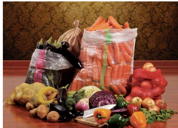
کیسه‌های مخصوص صنایع غذایی آرد و غلات، مصارف کشاورزی و کودهای شیمیایی

وجود تجهیزات مدرن و بروز شرکت، امکان ارائه خدمات تکمیلی کیسه‌ها اعم از چاپ، ضدآب کردن، مقاوم کردن در برابر پوسیدگی و رنگ‌پریدگی، روکش‌زنی کیسه‌ها با استفاده از روکش‌های BOPP، صدفی و متالایز و پاکتی کردن کیسه‌ها را فراهم آورده است.